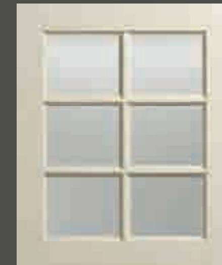
LACCATO PORO APERTO FRASSINO AVORIO