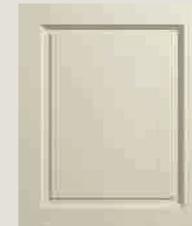
LACCATO PORO APERTO FRASSINO AVORIO