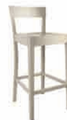
SGABELLO LEGNO CORDA ART. 472 COD. 6140L