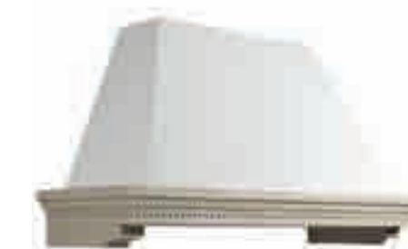
CAPPA VIRGINIA BIANCA