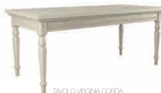
TAVOLO VIRGINIA CORDA