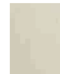
PORO APERTO FRASSINO AVORIO