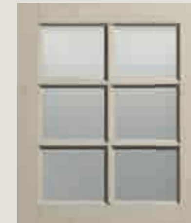
LACCATO PORO APERTO CORDA VETRO TRASPARENTE