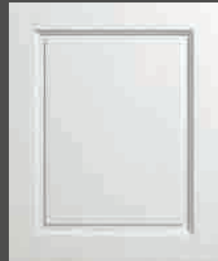
LACCATO PORO APERTO BIANCO