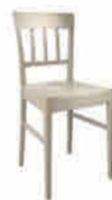
SEDIA LEGNO CORDA ART. 470 COD. 6120L