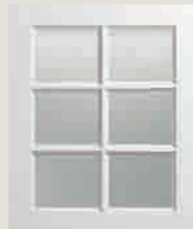
LACCATO PORO APERTO BIANCO VETRO TRASPARENTE