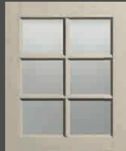
LACCATO PORO APERTO CORDA