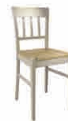
SEDIA PAGLIA CORDA ART. 470 COD. 6120