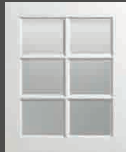
LACCATO PORO APERTO BIANCO