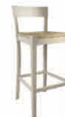
SGABELLO PAGLIA CORDA ART. 472 COD. 6140