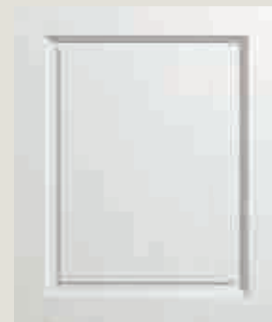
LACCATO PORO APERTO BIANCO