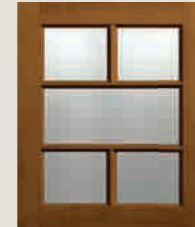
IMPIALLACCIATO CILIEGIO VETRO TRASPARENTE