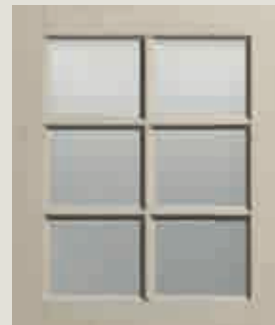
LACCATO PORO APERTO CORDA VETRO TRASPARENTE