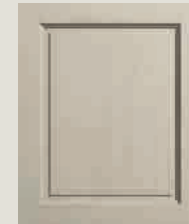
LACCATO PORO APERTO CORDA