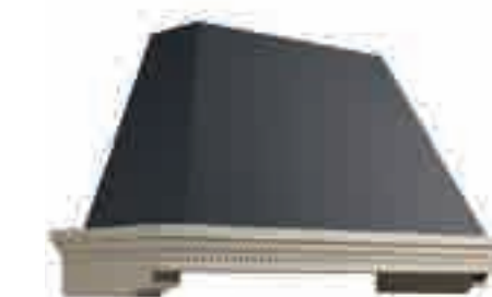
CAPPA VIRGINIA GRIGIA