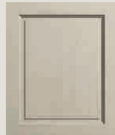
LACCATO PORO APERTO CORDA