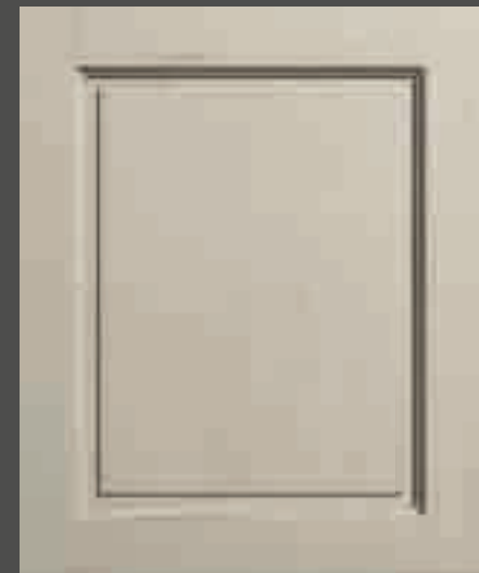
LACCATO PORO APERTO CORDA