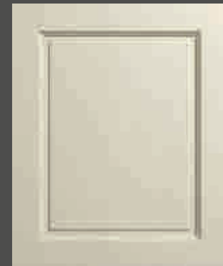
LACCATO PORO APERTO FRASSINO AVORIO